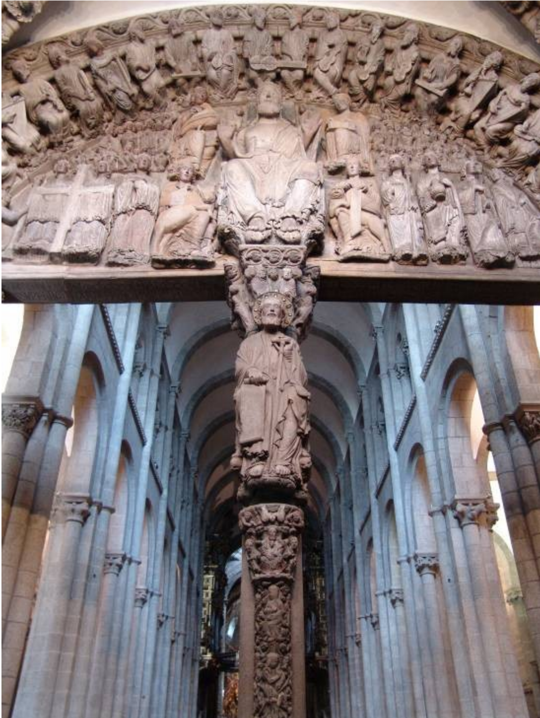
Parteluz, arquivoltas y tímpano del pórtico de la Gloria de Santiago. Se aprecia también la nave central, con bóveda de cañón con arcos fajones, la galería y la separación de las naves laterales con pilares y arcos de medio punto.