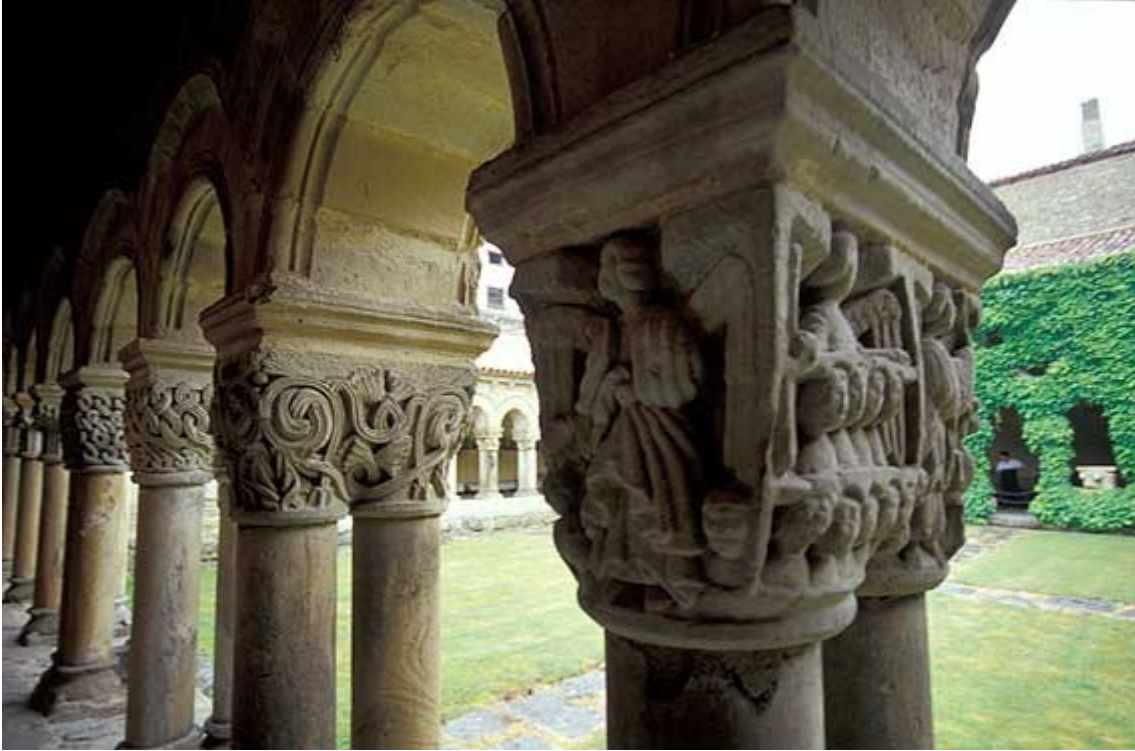
Capiteles del claustro de la Colegiata de Santillana del Mar (temas geométricos, vegetales y de escenas religiosas)