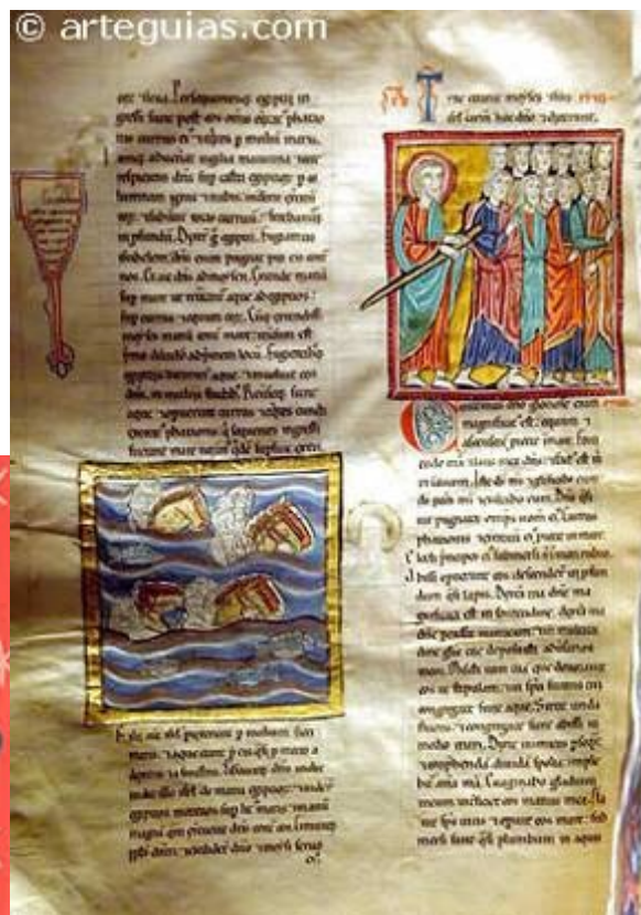
Biblia de San Millán de la Cogolla. S. XII al XIII