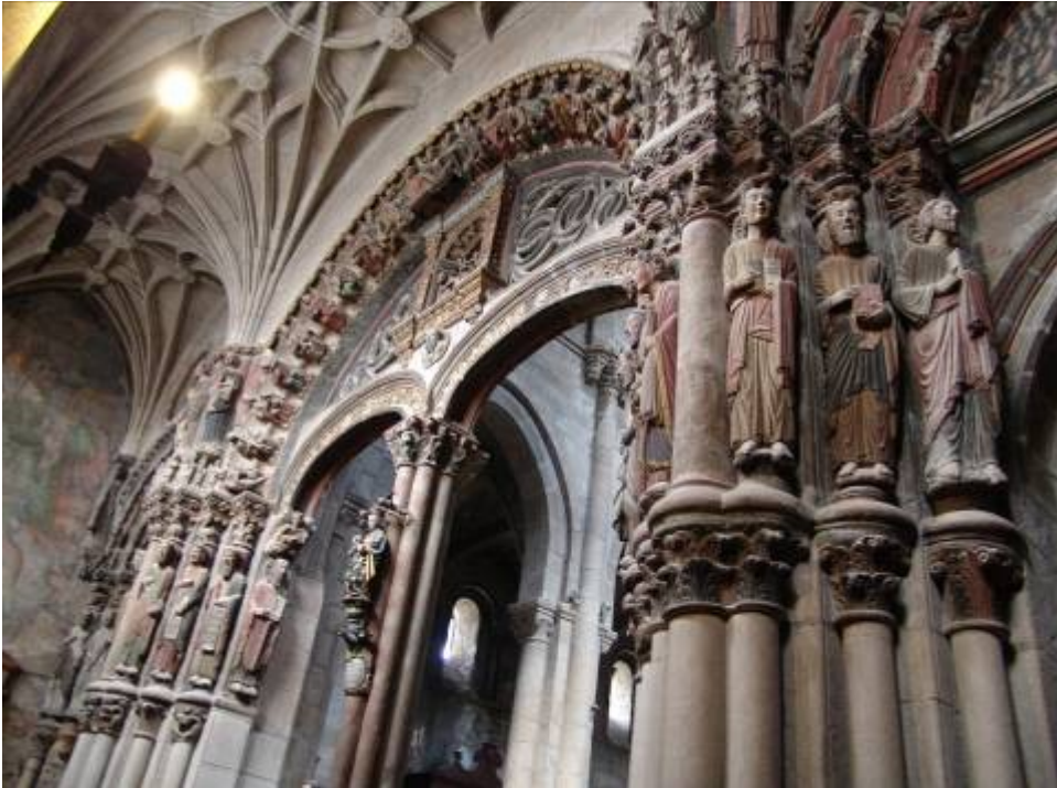
Pórtico del paraíso. Catedral de Orense.