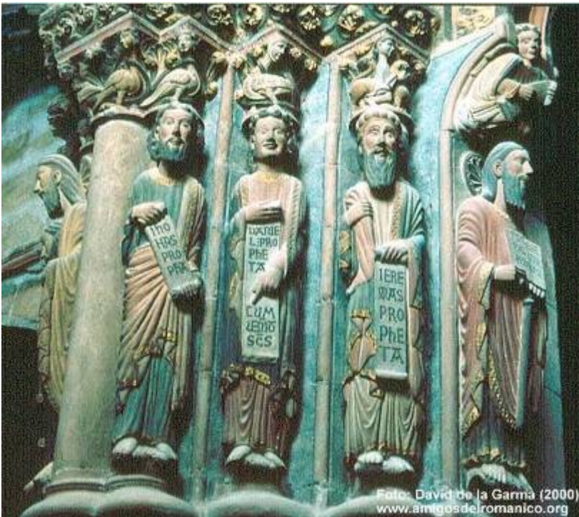
Pórtico del paraíso.

Catedral de Orense. Se aprecia perfectamente la policromía. Todas las portadas románicas y góticas estaban policromadas, pero sólo se conservan algunas como ésta y restos en la de Santiago porque estas portadas están cubiertas al estar en el Nartex.