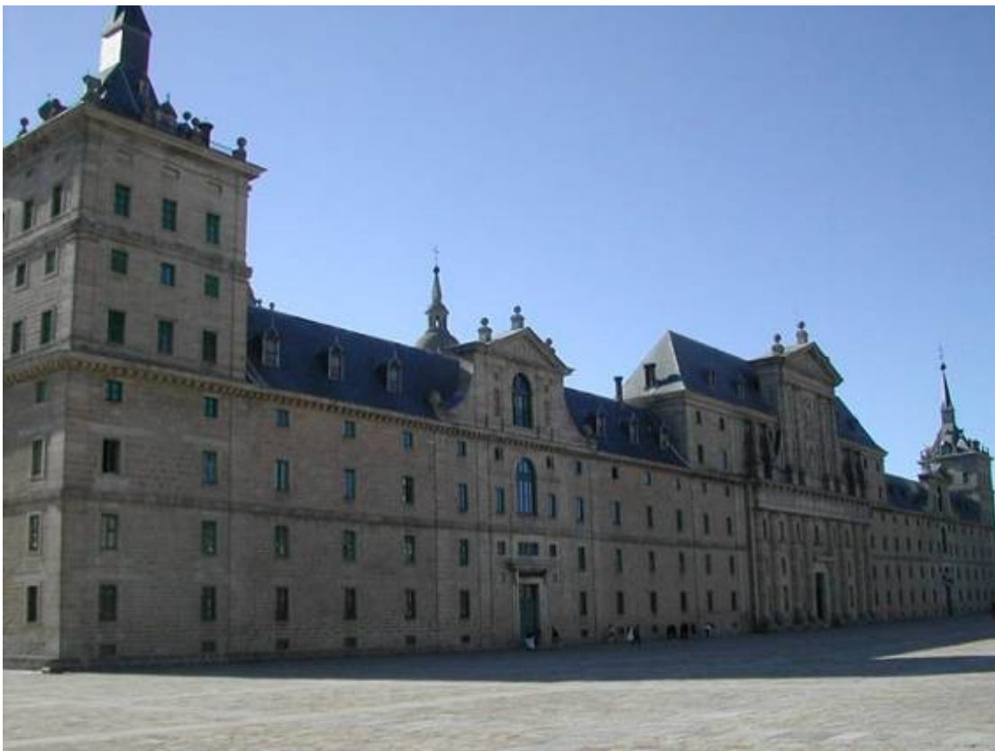
Fachada principal del Escorial