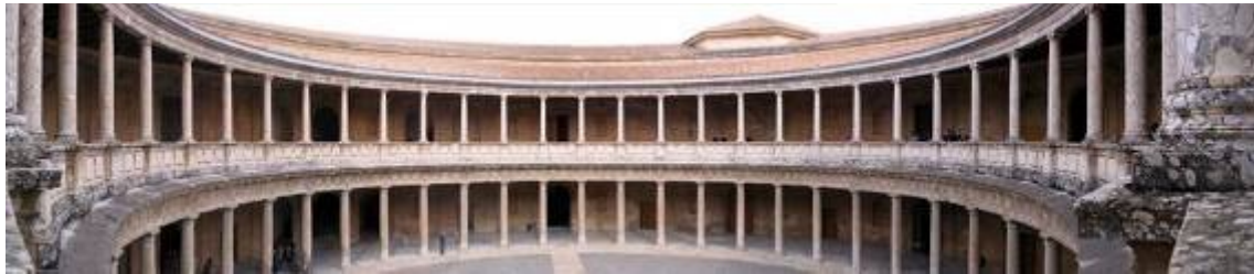
Patio circular del palacio de Carlos V.