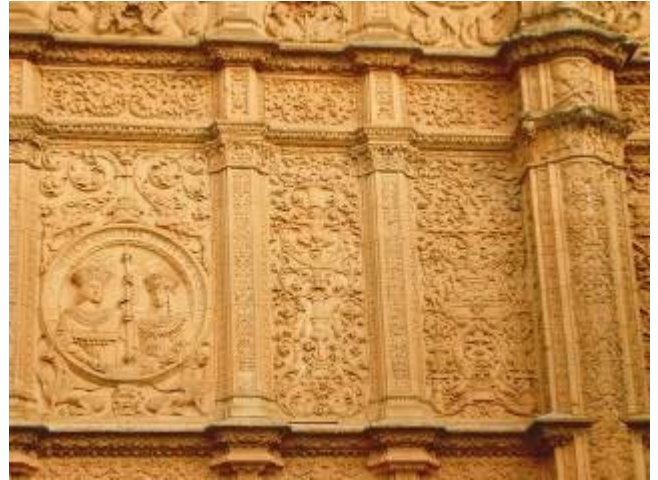
Fachada universidad de Salamanca (Detalle)